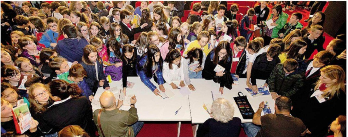
Uno degli affollati incontri con gli scrittori organizzati in presenza prima della pandemia